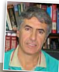
Λιαπής Ι.Κ. Κτηνίατρος- Cert.Ophthalmology